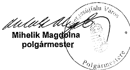
Mihelik Magdolna polgármester